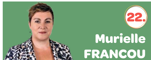
49 ans 📍 Rochefort 📞 0479/81.29.31

25000km parcourus à mes frais pour la visualisation et la résolution des problèmes quotidiens. Mon Combat, "POUR VOUS", avec de nombreux projets en réalisation en 2025, 2026... Accordez-moi votre confiance et votez pour un maximum de candidats.