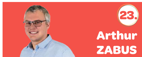
31 ans 📍 Rochefort 📞 0478/91.71.85

Parce que notre belle ville de Rochefort a besoin plus que jamais de continuer à se développer , pour toutes les générations actuelles et à venir, que ce soit au niveau culturel, humoristique ou encore touristique, dans un cadre de vie plus vert et plus propre, en toute sécurité pour nos enfants... Le 13 octobre prochain faites-nous confiance !