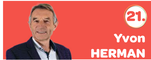
70 ans 📍 Jemelle 📞 0478/40.99.05